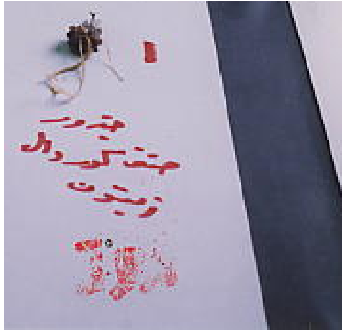
(1) توضيح عقل الزيتون الدقيقة المجذرة في وسط OM IBA